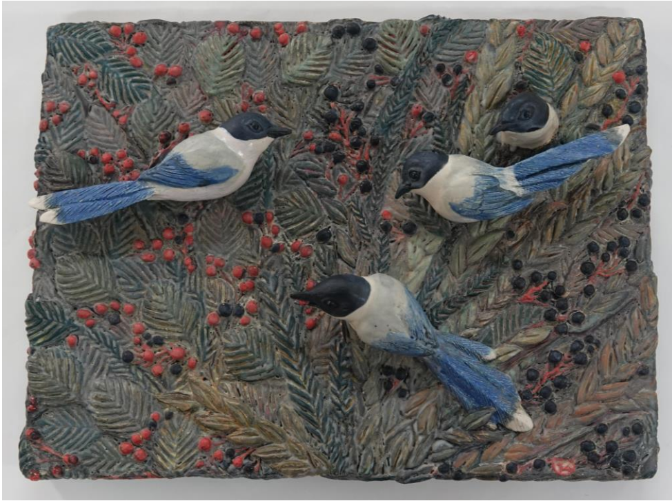
새이야기-물까치/ 41.5*31*7cm/2020년 작