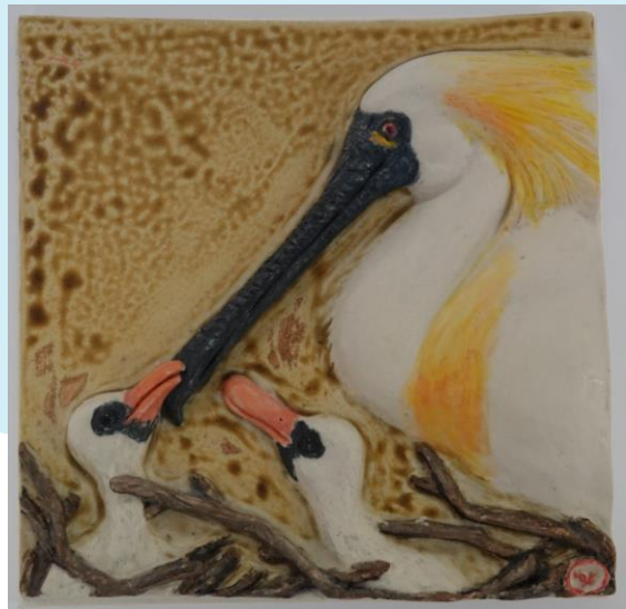
새이야기-저어새 /각 18*18*5cm /2023년 작