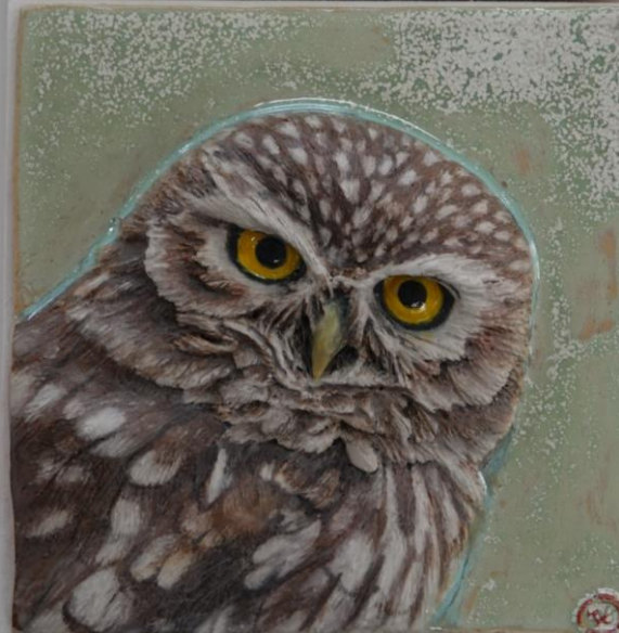
새이야기 -금눈쇠올빼미/18*18*5- 7cm/2024년 작